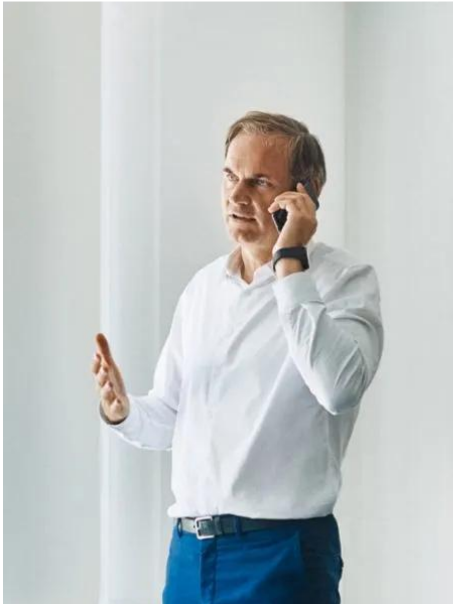
保时捷全球执行董事会主席 奥博穆（ Oliver Blume ）

就比方说我们的全新 911 或 Taycan 项目。我们总会遇到一些困难的情况，需要借助团队的力量来攻克。起决定性作用的是充足的准备工作，做到身体力行，争分夺秒。每个人都为他人考虑。