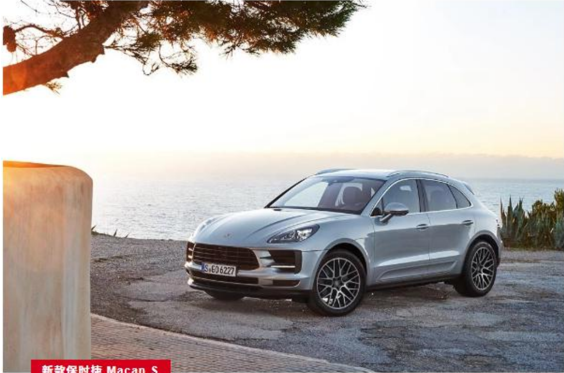
新款保时捷 Macan S

保时捷进一步扩充新款 Macan 的家族阵容，发布动力强劲的新款 Macan S。新车搭载全新开发的 3.0 升 V6 涡轮增压发动机，最大输出功率达 260 kW (354 hp)，峰值扭矩达 480 Nm，较旧款车型提升了 10 kW (14 hp) 和 20 Nm。搭配选装的 Sport Chrono 组件时，新款 Macan S 从静止加速到 100 km/h 仅需 5.1 秒，比旧款车型缩短 0.1 秒。新车最高时速可达 254 km/h。