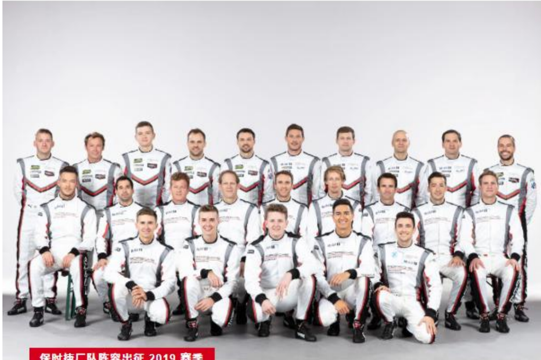
保时捷厂队阵容出征 2019 赛季

2018 赛季的引擎轰鸣声仍留有余音,保时捷赛车运动已经热血勃发地开启了 2019 赛季的征程。在魏斯阿赫举行的 2018 冠军之夜赛车运动晚宴上,保时捷对本赛季车队与车手们在全球范围内取得的出色成绩给予了高度评价。此外,保时捷宣布在继续发力全球 GT 项目的同时,也将融入更多创新元素。