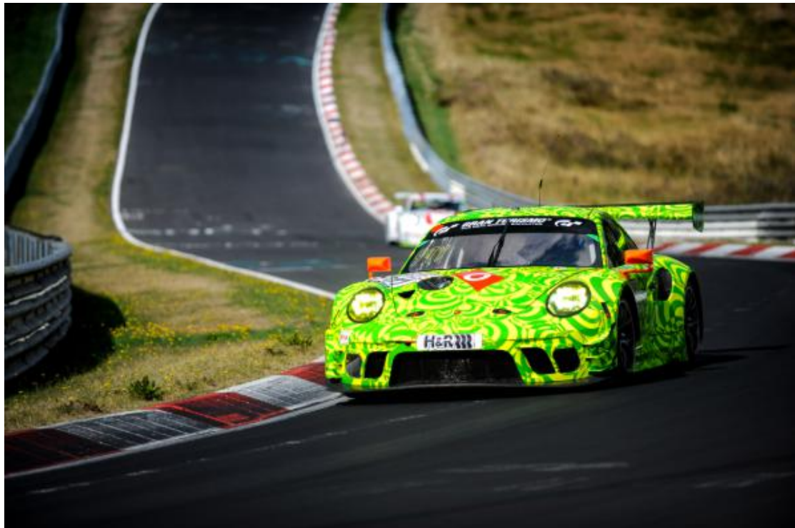
保时捷 911 GT3 R（2019 款）在纽博格林赛道北环赛道

在全球的 GT3 赛事中，保时捷将继续为客户车队提供鼎力支持。搭载高效空气动力学科技并显著提升驾驶性能的全新 911 GT3 R 将首度出战。截至目前，这台客户赛车已经由保时捷赛车运动部门售出 45 台。