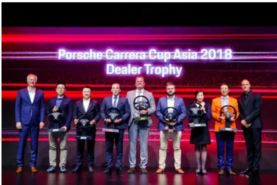
2018 亚洲保时捷卡雷拉杯经销商车队颁奖仪式