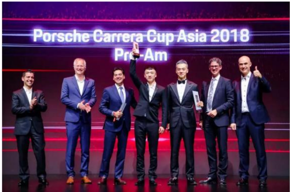
2018 亚洲保时捷卡雷拉杯绅士组前三甲颁奖仪式