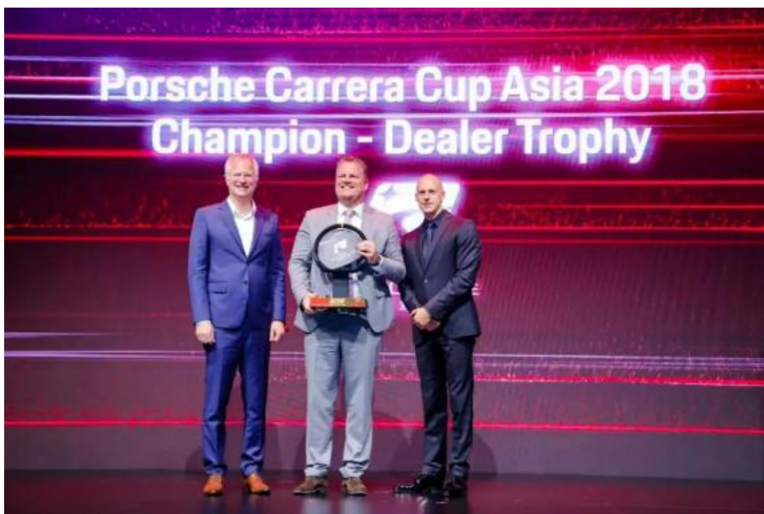
追星车队荣登本赛季经销商积分榜榜首