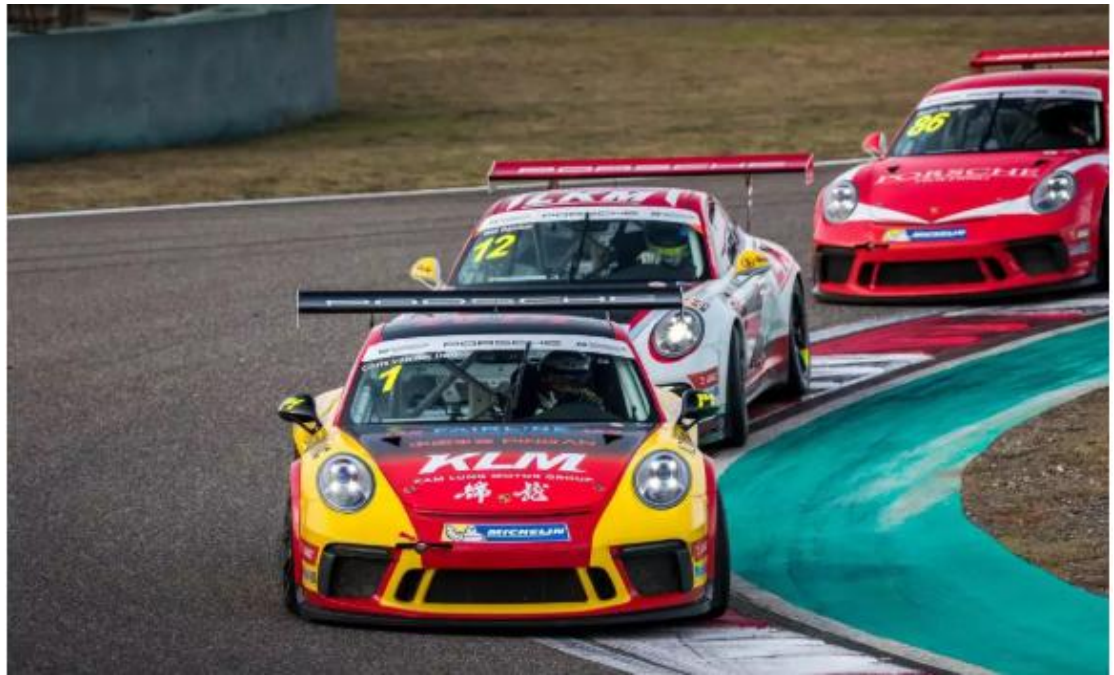
第十二回合威廉（Will Bamber）向首位发起猛攻 最终因碰撞遗憾退赛