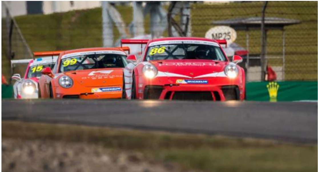
第十二回合战况空前激烈，前三甲车手多番缠斗