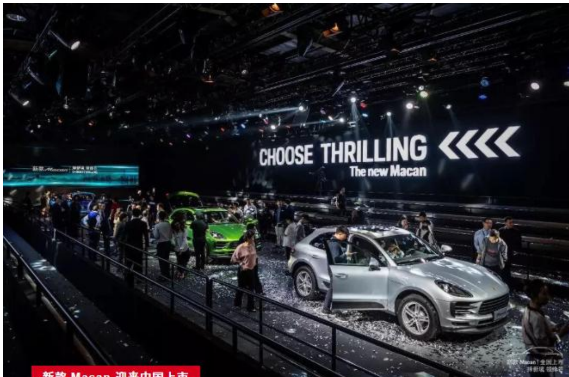
新款 Macan 迎来中国上市

自 2018 年 7 月 25 月在中国与全球消费者见面之后,新款 Macan 掀起了一股属于保时捷独特魅力的风暴。而就在 11 月 10 日,这款型格愈现的紧凑型 SUV,在 300 多位保时捷客户和老朋友面前,凭借独一无二的沉浸式表演所打造出的 Macan 探险之旅展现了一个更加鲜活而华丽的形象。