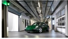
里程碑! 第一百万辆 911 成功下线