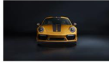
限量 500 台 | 全球最 Unique 的 911 Turbo S Exclusive Series 开始预订!