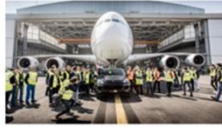
新吉尼斯世界纪录! 保时捷卡宴 VS. 空客 A380