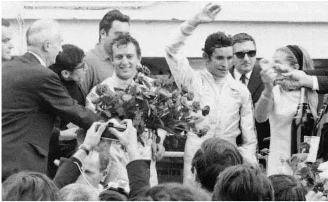
帅气地挥手致意的就是 Jacky Ickx