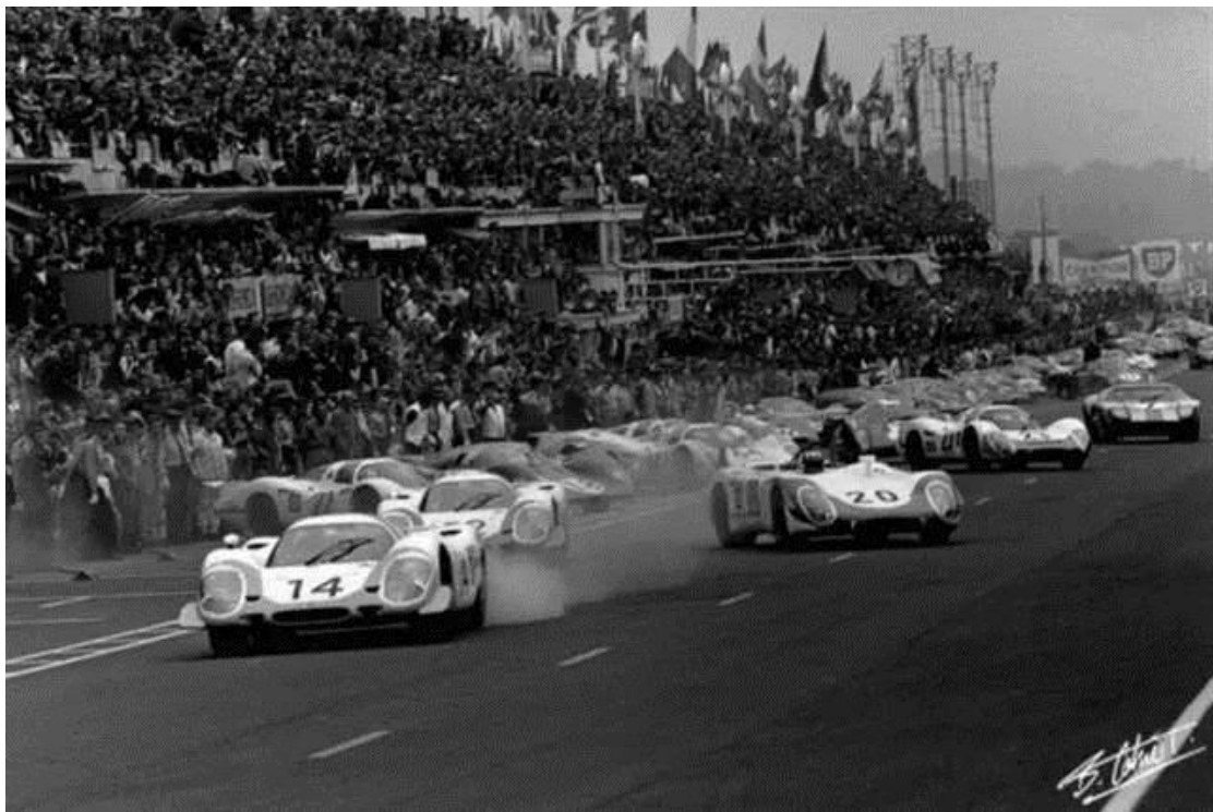
比赛开始几秒后，4 台保时捷领先冲出发车区