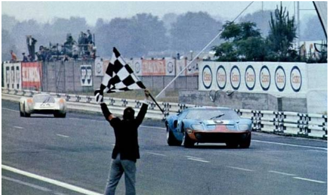
1969 年勒芒终点线，冠军福特 6 号 GT40 赛车仅领先保时捷 64 号 908 赛车短短数秒，这也是 1970 年前保时捷离勒芒冠军最近的一次

须知在变数极大的一整天中，车队和车手的任何动作都是争分夺秒的，因为比赛结束时第一第二名的差距可能只有几秒钟。所以车手不但要跑得快，还得熟练地以最快的动作点火发车，以取得几秒钟的优势。