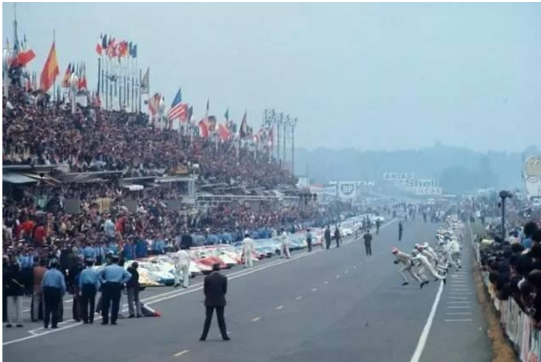
代表比赛正式开始的法国国旗刚刚挥下(图左下角)车手们冲向赛车