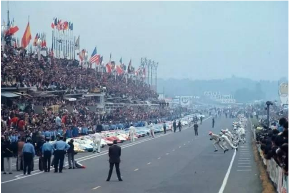
赛车统一摆放在勒芒发车直道的一边

须知在变数极大的一整天中，车队和车手的任何动作都是争分夺秒的，因为比赛结束时第一第二名的差距可能只有几秒钟。所以车手不但要跑得快，还得熟练地以最快的动作点火发车，以取得几秒钟的优势。