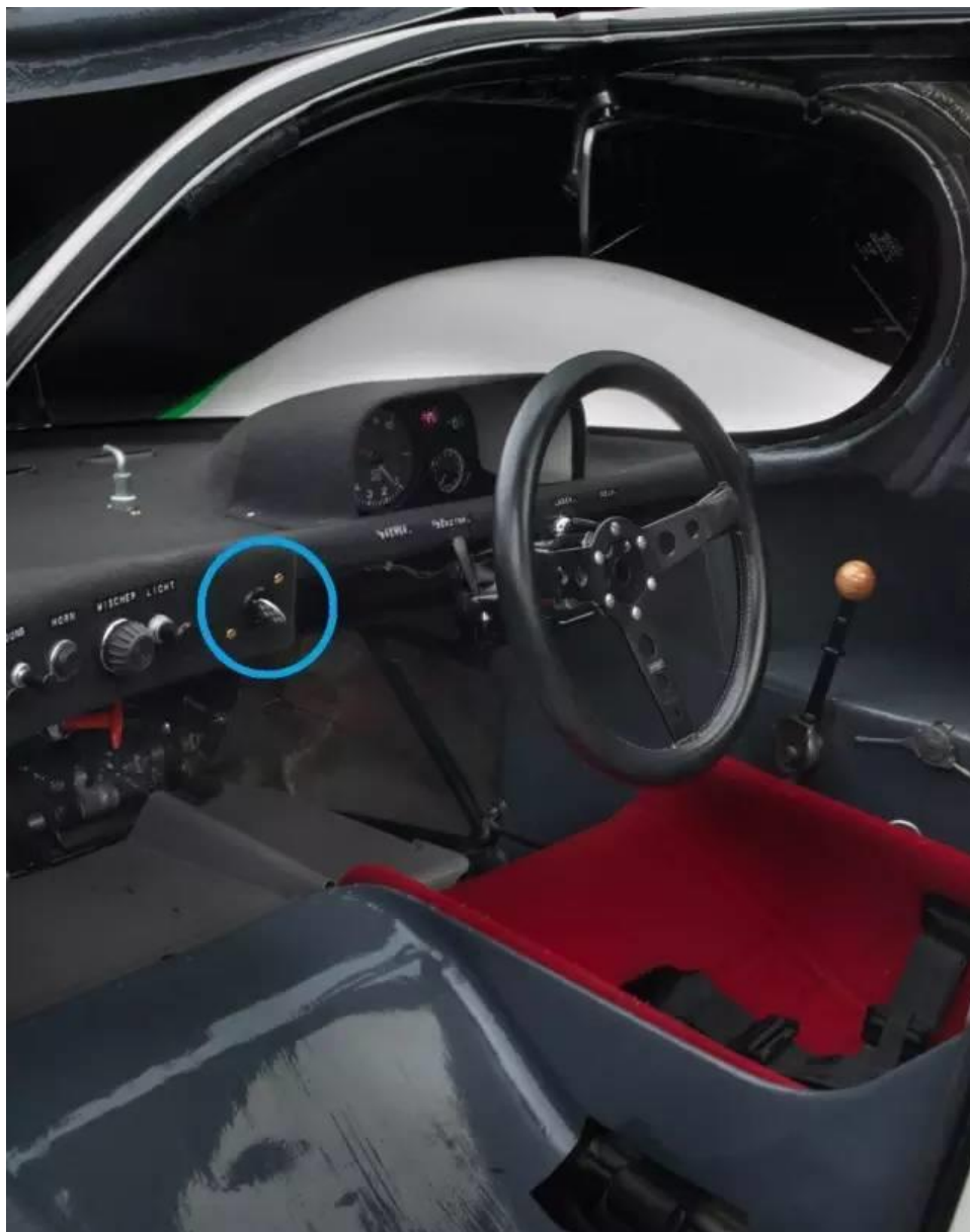
排杆另一边的蓝圈中就是点火钥匙

这时候另一只手是闲着的。那为什么不让闲着的手也忙起来呢？于是在保时捷赛车上钥匙孔被移到了方向盘相对排挡杆的另一边。