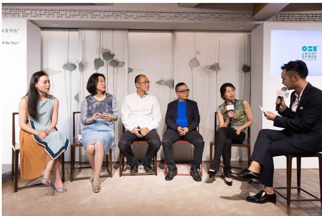
活动现场对话艺术家

青年艺术人才的培养和支持是保时捷“溢彩心”企业社会责任项目的核心实践之一。2010年至2016年，保时捷中国携手四川美术学院共同推出了“溢彩心”艺术作品征集活动，致力于奖励和支持具有天赋的中国青年艺术人才，为其提供展露艺术才能的舞台。