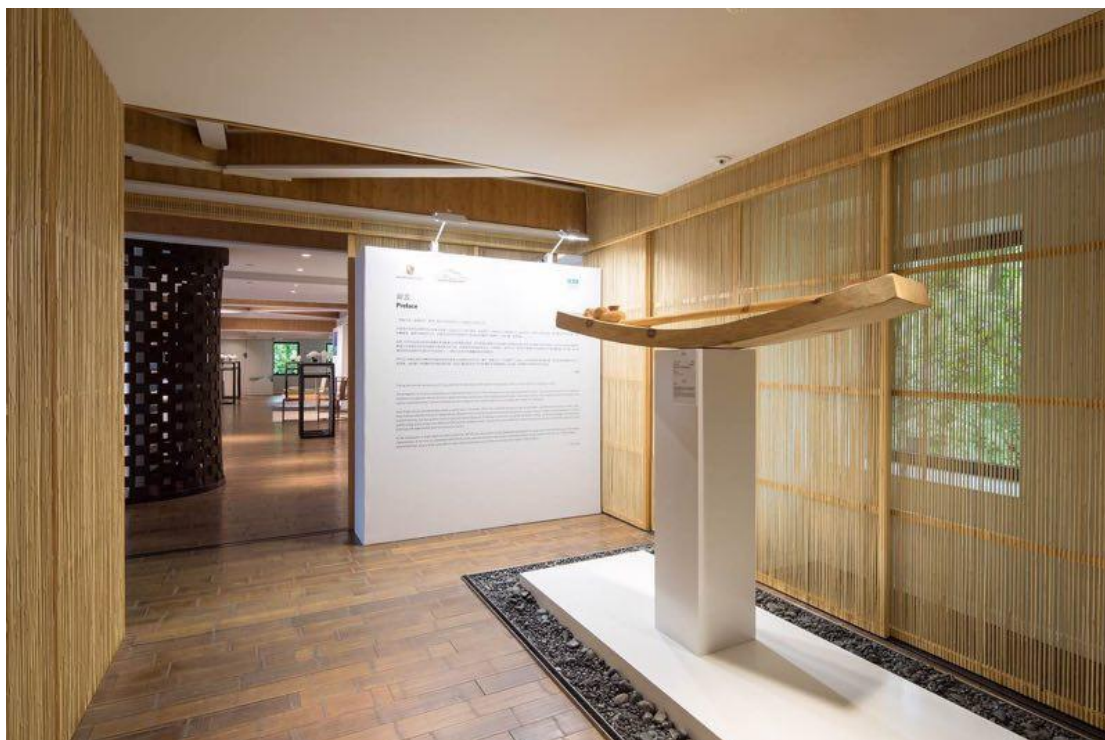
“中国青年艺术家年度评选”的发布会现场艺术感十足