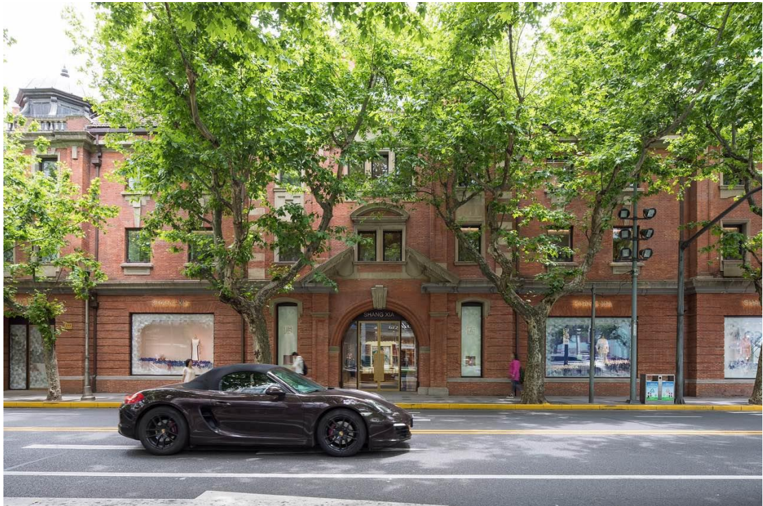
保时捷首届“中国青年艺术家年度评选”启动新闻发布会在上下之家隆重举行

5月25日，由保时捷中国与ART021上海廿一当代艺术博览会携手举办的首届“中国青年艺术家年度评选”正式拉开帷幕。活动旨在为中国当代艺术当下的变化和未来的发展，提供 新鲜的视角和实践 。活动邀请了国内知名艺术家、策展人、艺评人等专业资深人士组成提名委员会，并打造“ 提名委员会+院校代表+媒体评审 ”全方位评选机制，最终遴选出 三位年度中国青年艺术家 。