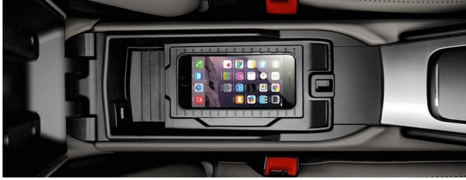
保时捷智慧互联系统，为生活提供更多可能

保时捷智慧互联模组升级版已经在全新 Panamera 及 911 上标配，全新 718 车系，Macan 和 Cayenne 也可选装。升级版的智慧互联更加全面，不仅配备 LTE 电话组件，Wi-Fi 热点，并且支持 Apple Carplay 和信息娱乐服务。值得一提的是，在中国，保时捷还提供了专属的礼宾服务。