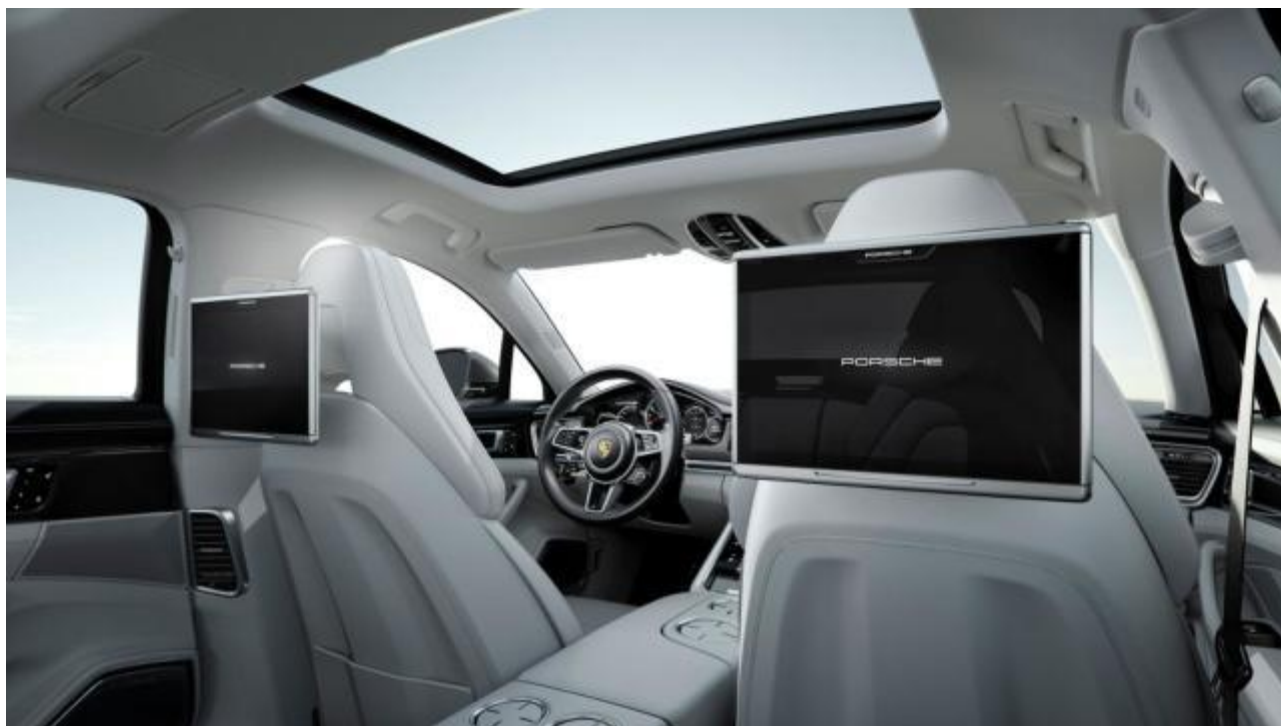
全新 Panamera 行政加长版的后排娱乐系统，让后排乘客也可以随时随地与外界联通

保时捷还将在 2017 年上半年推出保时捷 ID、保时捷智慧互联门户、保时捷智慧互联商店和保时捷智慧互联支持等多项在线服务，并持续致力于构建一个独一无二、高端的互联生态体系，以进一步丰富保时捷车主的互联驾乘体验。