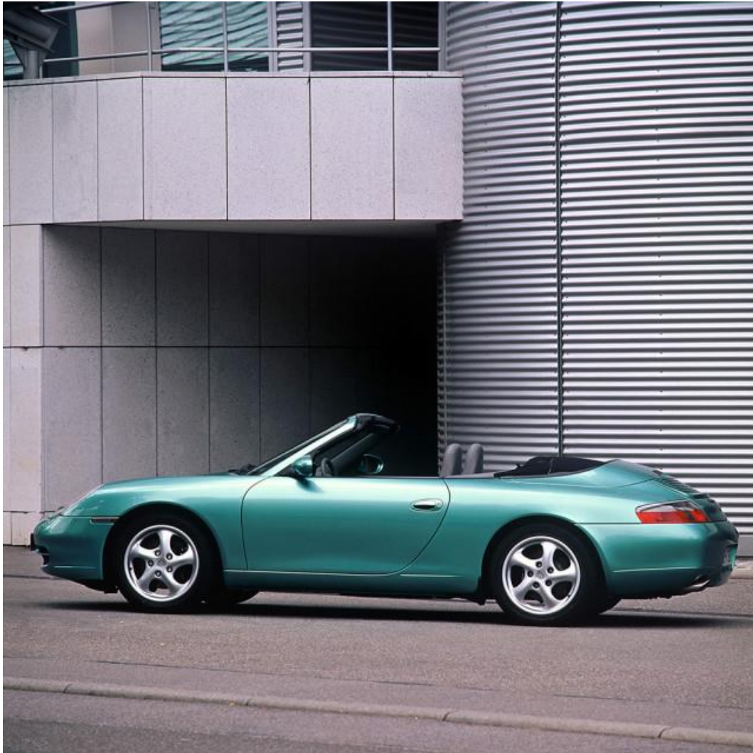
Jan Koum 的第一辆保时捷（第五代 911）—— 911 Carrera Cabriolet

Koum 买的第一台保时捷是 2003 年的 911 Carrera 敞篷版。现在，他也是 964 和 993 系列双门硬顶跑车的粉丝。“上世纪 90 年代，没有比驾驶原始的风冷保时捷更爽的了。” 他不断收集 911 系列，同时也一直在寻找两个车型：964 RS 3.8 和轻质结构的 964 Turbo S。“我更倾向于买一台可以选择去掉收音机的车，” 他说到，“因为最好的天籁来自六缸发动机。”