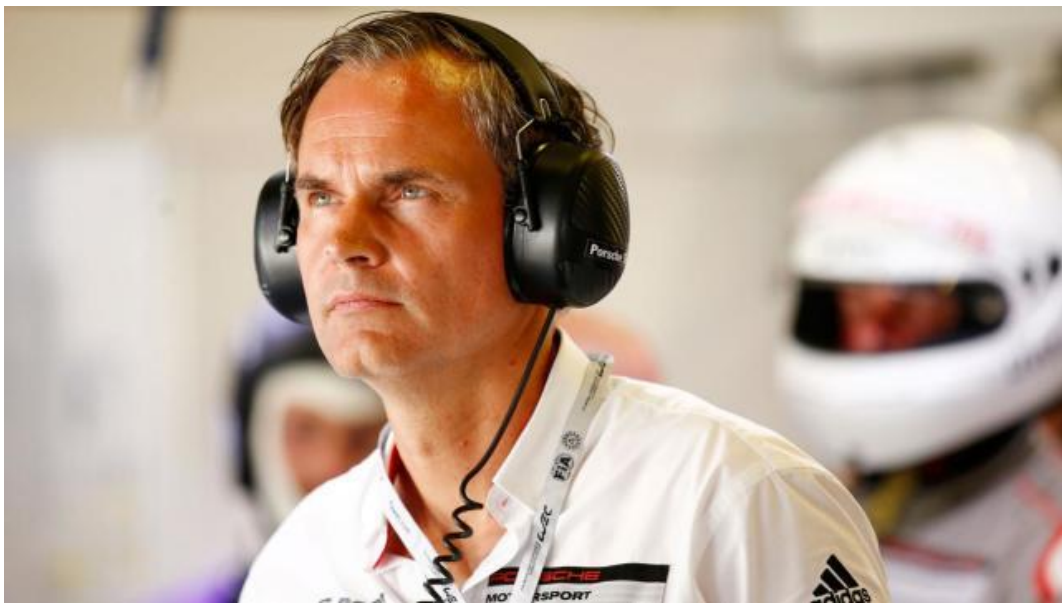
保时捷全球执行董事会主席奥博穆博士 (Dr. Oliver Blume) 也到场助阵