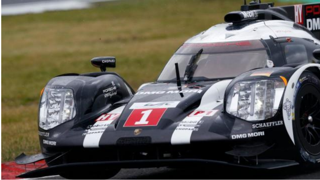
展现未来跑车技术的 919 Hybrid