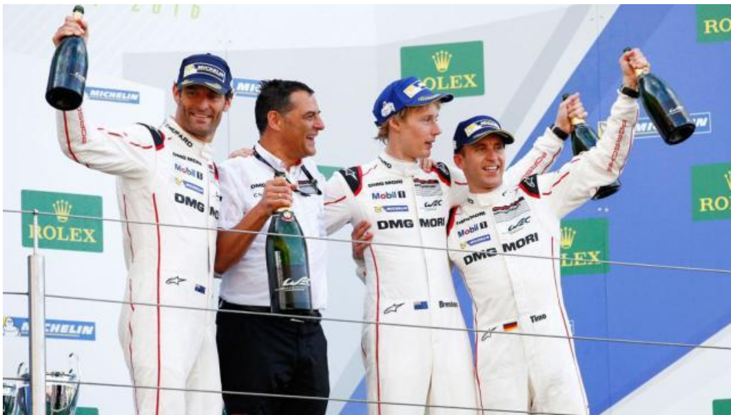
保时捷全球负责研发的执行董事会成员 Michael Steiner 博士上台祝贺车手们取得胜利

这已经是继银石和勒芒之后，919 Hybrid 在本赛季取得的第三次胜利了。自 2014 年首发以来，这款赛车已经赢得了 10 次伟大的胜利。保时捷目前以 164 分领跑整车厂队积分榜，榜眼和探花分别是奥迪车队（129 分）和丰田车队（97 分）。