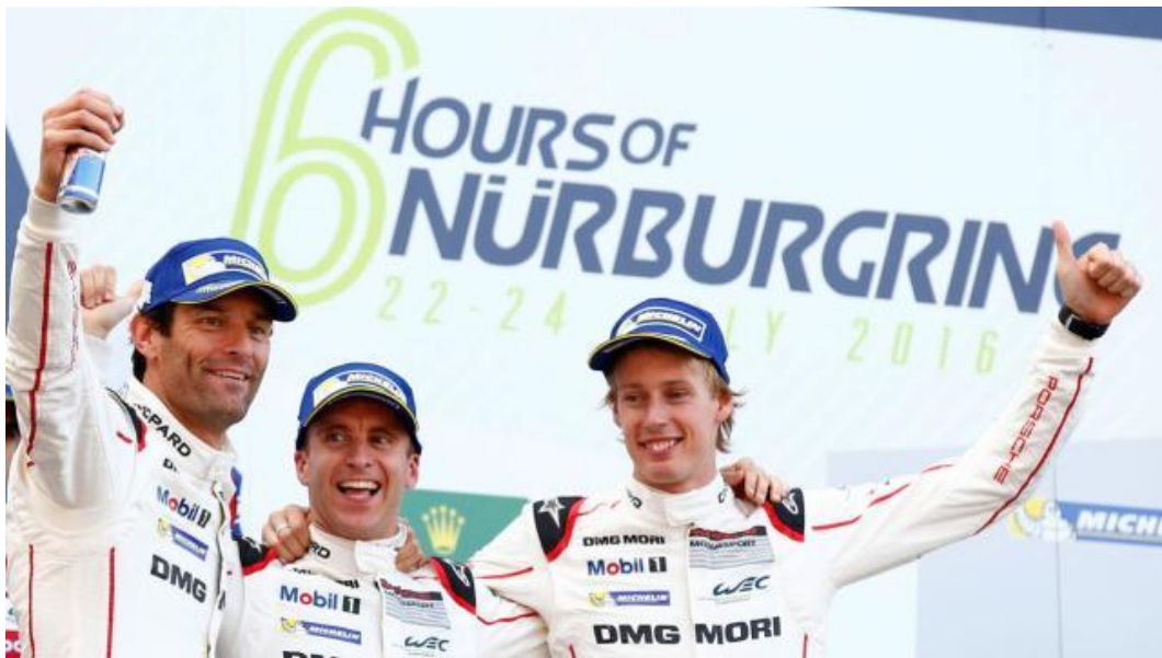
冠军车手 Mark Webber, Timo Bernhard 和 Brendon Hartley

虽然本次比赛有很多颜值与实力其辉的对手，但作为 2015 年 WEC 纽博格林站的卫冕冠军，保时捷车队为本站的比赛做了充足的准备，冠军车手 Mark Webber, Timo Bernhard 和 Brendon Hartley 经过一场艰苦卓绝的努力，驾驶 919 Hybrid 1 号战车成功卫冕本次 6 小时耐力赛。通过这场比赛，保时捷继续扩大了其在 FIA WEC 积分榜上的优势。Romain Dumas, Neel Jani 和 Marc Lieb 在本站获得第 4 名，并继续领跑总积分榜。