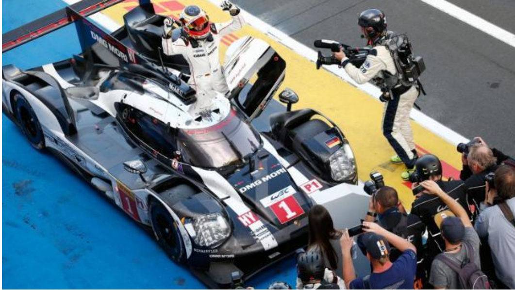
Bernhard 驾驶保时捷 1 号战车将胜利带到终点