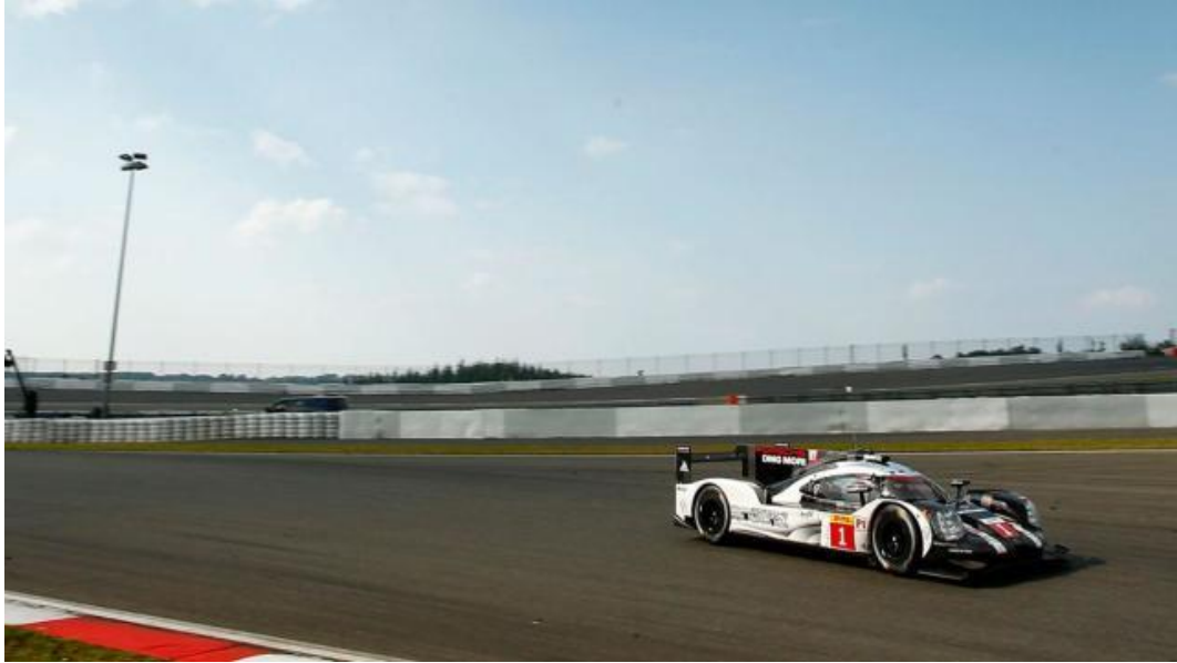
919 Hybrid 1 号车一往无前，即将驰往下一场胜利