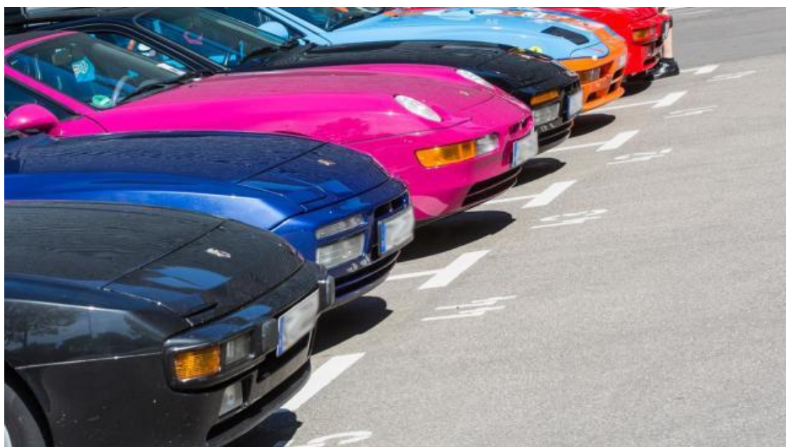
“前置后驱”家庭大联欢

近日，保时捷博物馆用 924、928、944 和 968 的特别展，向 变速驱动桥的 40 周年 致敬——其中部分展品还是首次公开展出，曾经的革新之作，如今已经成为收藏市场上炙手可热的经典。跟随 “变速驱动桥时代” 一起感受保时捷对变速驱动桥时代的特殊感情。