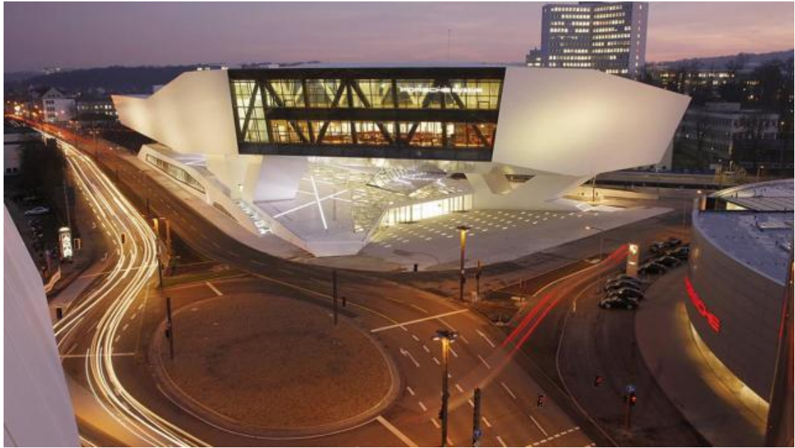
位于斯图加特的保时捷博物馆新馆

温馨提示：截至十月中旬，保时捷博物馆将举行 “标新立异 40 年——前置发动机、后置驱动” 的特别展览，围绕此主题展出 23 台整车，其中超过一半的汽车展品是首次对公众开放哦～还不赶紧列入 list 吗？