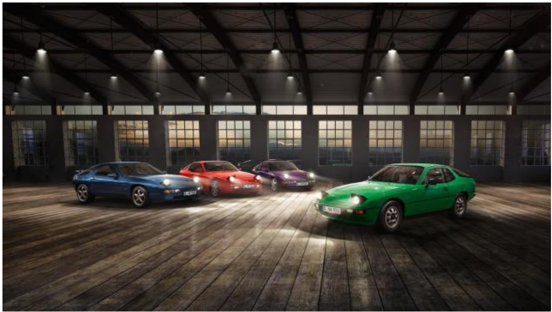
灯光之下，倾听彼此的故事