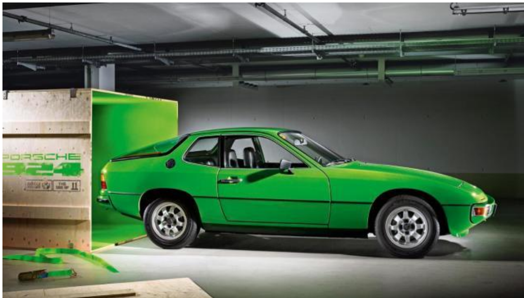
赛场之上 924 英姿飒爽，赛场之外它其实蛮文艺

40 年前，保时捷一改 911 车型后置后驱既定原则，推出一台史无前例的跑车：前置发动机、后置驱动、充裕的中部空间。这款 搭载变速桥驱动时代的现代化四缸跑车 924 震撼了世界，得益于市场定位“家庭运动旅行车”，几年后它成为最为畅销的跑车之一。