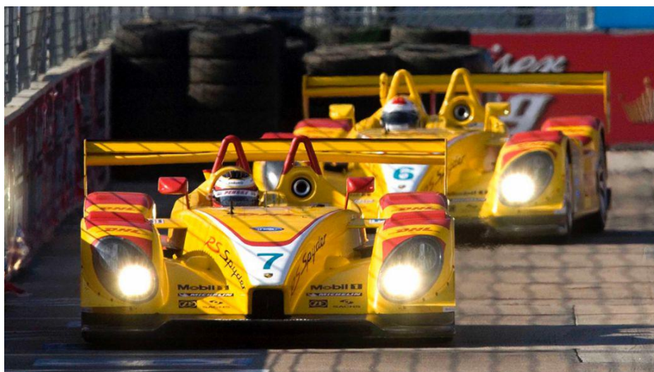
2008 赛季中在赛百灵赛道驰骋的保时捷 RS Spyder 赛车

凭借保时捷 RS Spyder，潘世奇车队在 2006 至 2008 年连续三年获得了 LMP2 组别的全部头衔，甚至多次击败了速度更快的 LMP1 赛车夺得全场冠军。上世纪七十年代，这支美国车队也凭借传奇赛车保时捷 917 在泛美赛事中取得巨大成功。