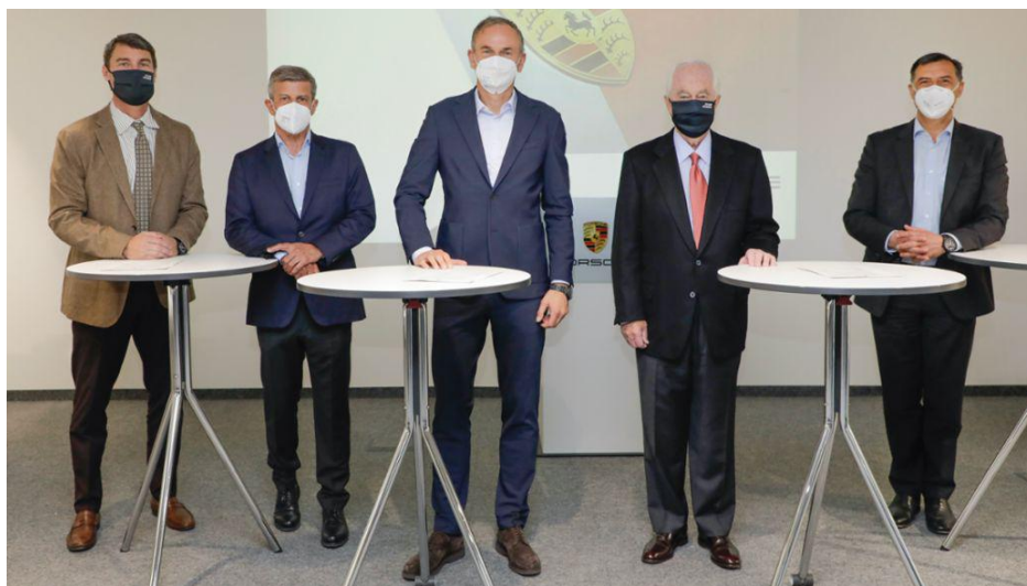
保时捷与潘世奇车队的签约仪式现场

这支成功的美国团队将与来自魏斯阿赫的专家合作，在国际汽联世界耐力锦标赛（WEC）和北美 IMSA 卫士泰克跑车锦标赛（IWSC）中以厂队身份参赛。以保时捷潘世奇车队之名，两台引人注目的 LMDh 原型车将在两个系列赛的顶级组别争夺总冠军。来自斯图加特的跑车品牌与成立于 1966 年的美国车队间的合作将持续数年。