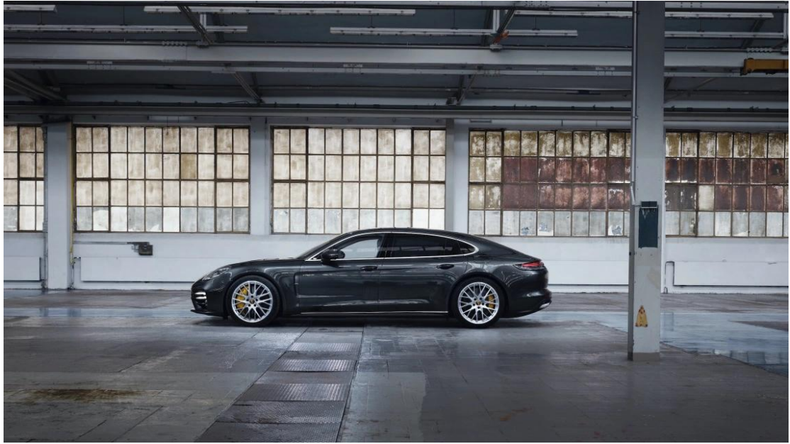
新款 Panamera Turbo S E-Hybrid 行政加长版