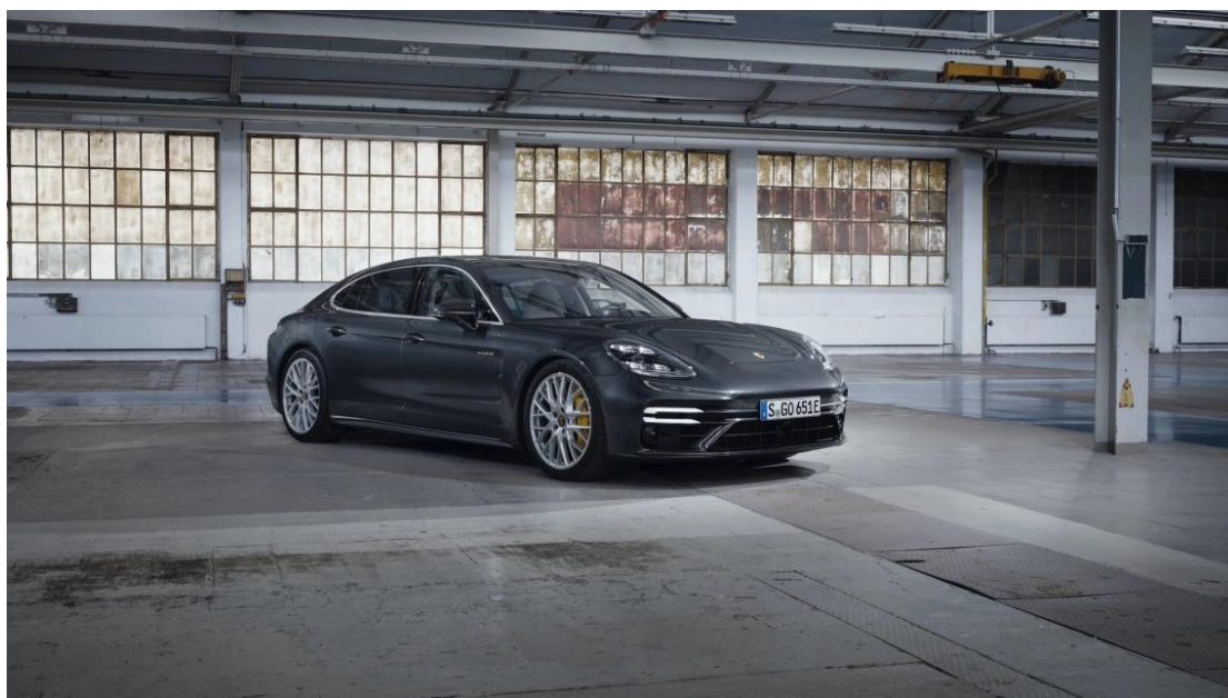
新款 Panamera Turbo S E-Hybrid 行政加长版

性能旗舰新款 Panamera Turbo S E-Hybrid 行政加长版 由一台 420 kW (571 PS) 的四升双涡轮增压 V8 发动机和一台 100 kW (136 PS) 的电机协同驱动，系统输出功率由此前的 404 kW (550 PS) 提升至 420 kW (571 PS) 。结合标配的 Sport Chrono 组件，旗舰车型从静止加速至 100 km/h 仅需 3.2 秒 （提升 0.2 秒 ），最高车速达到 315 km/h （提升 5 km/h ）。