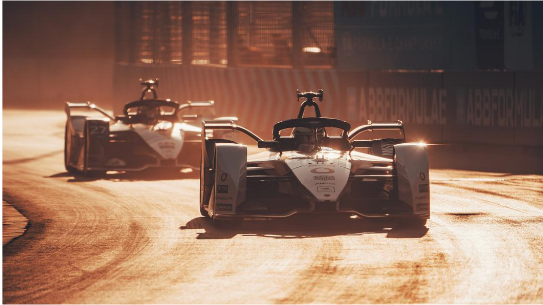
99X Electric 在利雅得站的比赛中