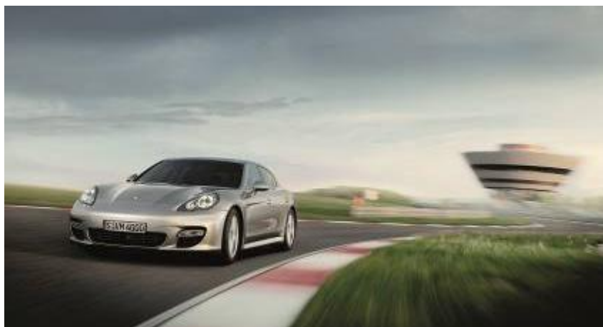
第一代 Panamera 7 分 56 秒