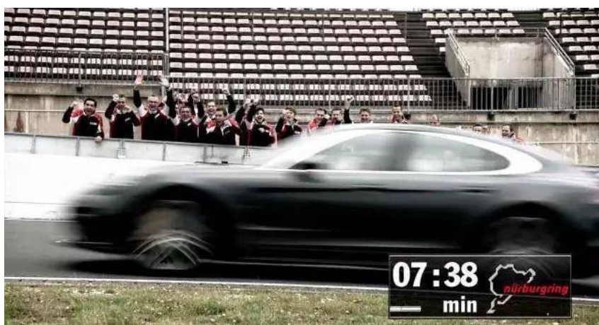
第二代 Panamera 7 分 38 秒 46

如今，新款 Panamera 带着 7 分 29 秒 81——最新纽北“长轴距车型”圈速王的答卷，再一次为“同级最佳性能表现”正名！