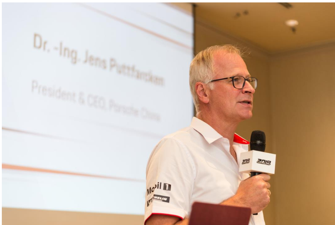
保时捷中国总裁及首席执行官严博禹博士