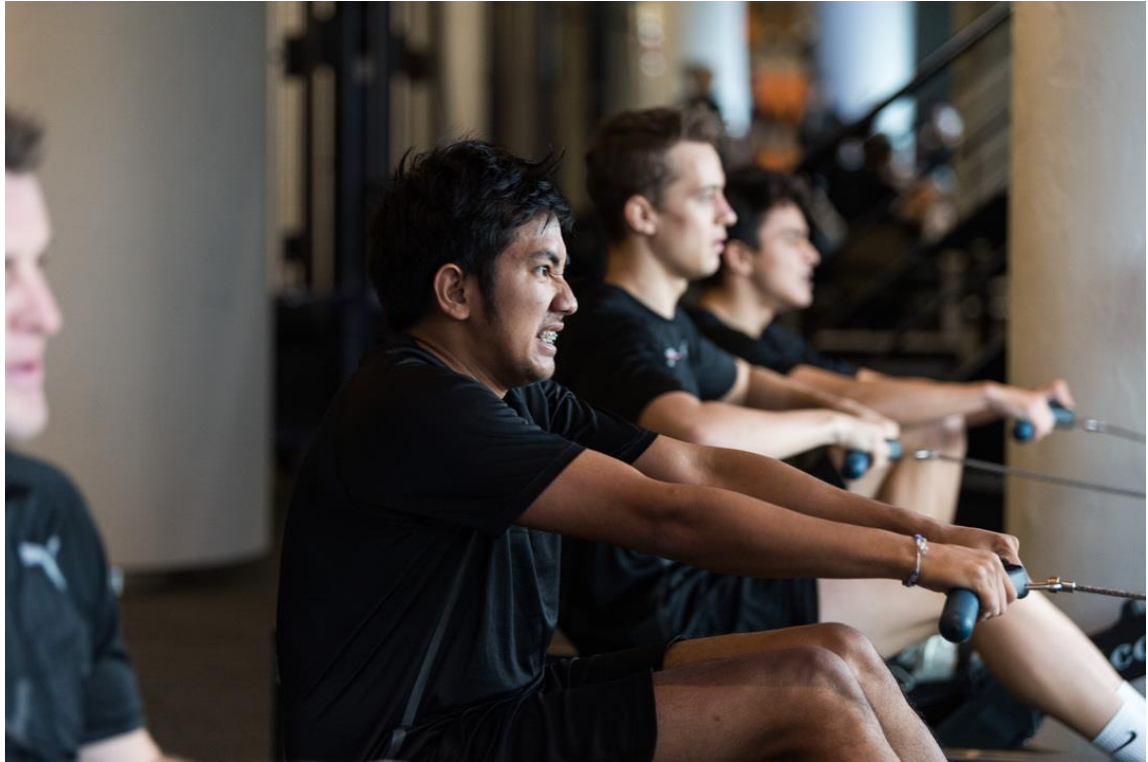
青年车手人才库训练营