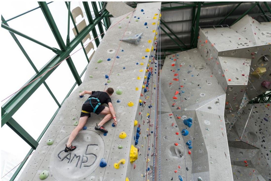
青年车手人才库训练营