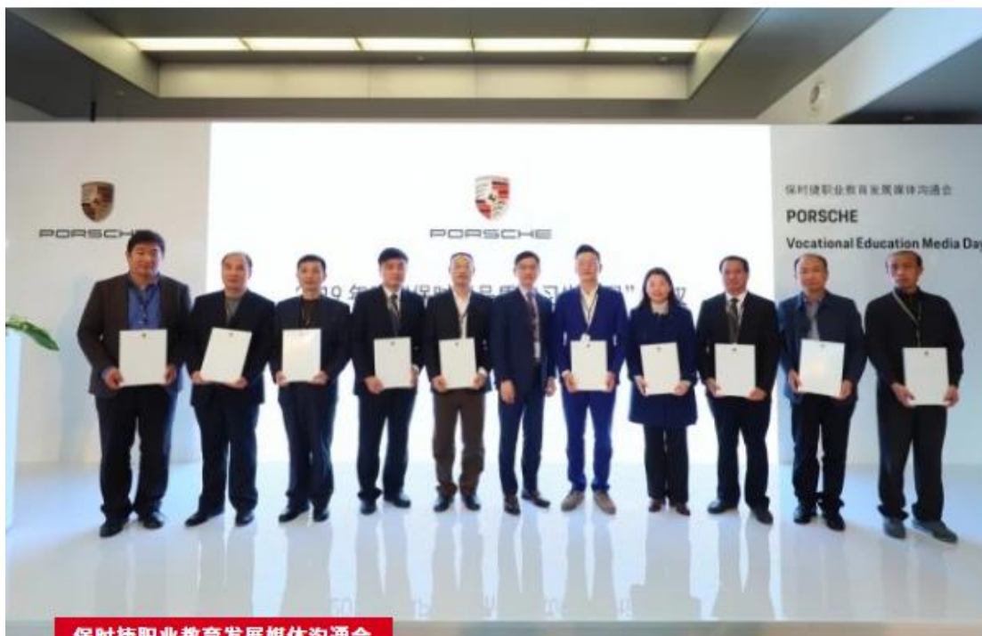
保时捷职业教育发展媒体沟通会

保时捷职业教育发展媒体沟通会已于 11 月 23 日顺利举行。活动中，保时捷中国人才学院与 10 所高等职业院校进行了 2019 年度 PEAP（保时捷品质实习生项目）合作授权，同时首次介绍全球化职教项目：PAVE（保时捷售后服务职业教育项目），以此开启保时捷中国职业教育的新阶段——融合本土实践与国际标准，实现企业社会责任深度践行。