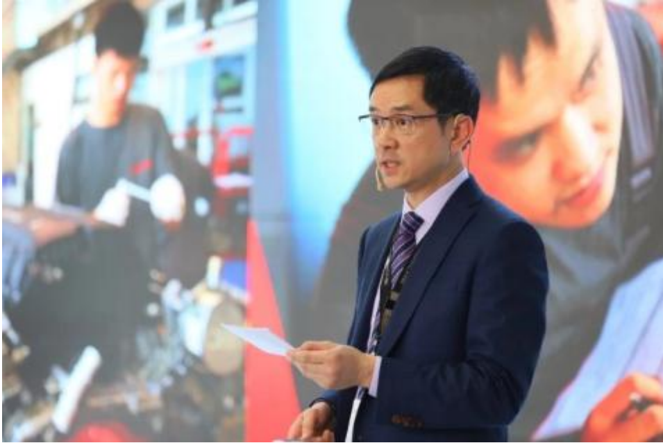
保时捷中国人才学院总监