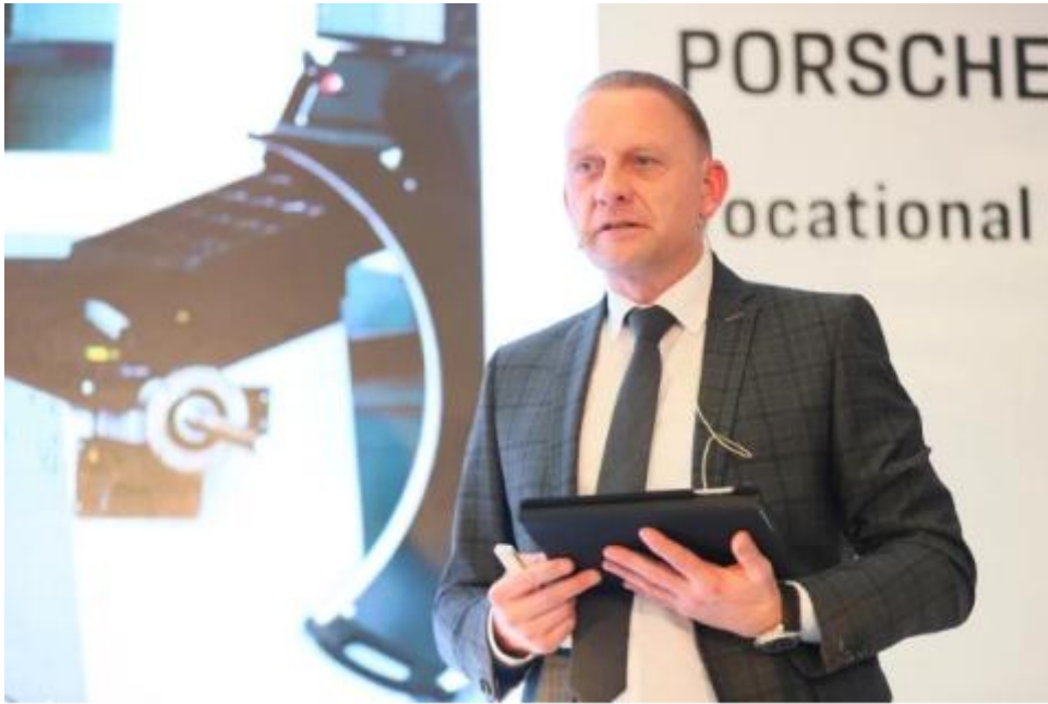
保时捷德国资格准入概念经理