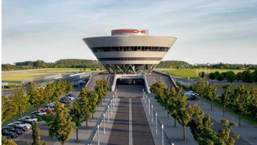
“Diamond”（钻石）大楼实景，莫非这就是“反差萌”？

这座“钻石”大楼拥有一座小型博物馆、餐厅和举办主题讲座的会议室；此外，大楼外是长达 3.7 公里的试驾道路以及 6 公里的越野路线，可供来自全球各地的保时捷拥趸们试驾保时捷的各种车型，该保时捷体验中心每年接纳来自全球各地超过 40,000 名访客。