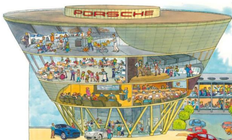
绘本中的“Diamond”（钻石）——位于莱比锡的保时捷体验中心大楼

画面中最显眼的莫过于画面左上角这座造型别致的建筑——它就是保时捷在莱比锡的体验中心大楼，因其造型酷似钻石而被人们亲切地称为“Diamond”（钻石）。